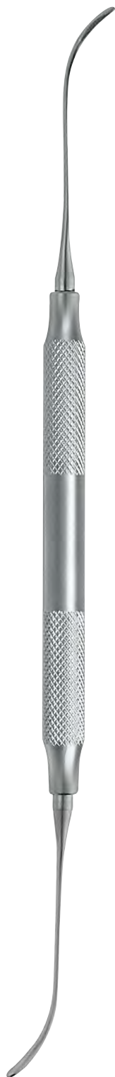
FIG. 2 20,7 cm