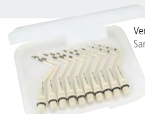
Verpackungsbeispiel Sample packing